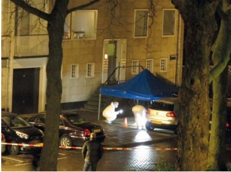
Recherche onderzoekt de plaats delict in de Comeniusstraat