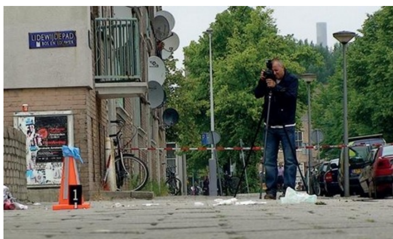
De recherche onderzoekt de schietpartij in de Gulden Winckelstraat