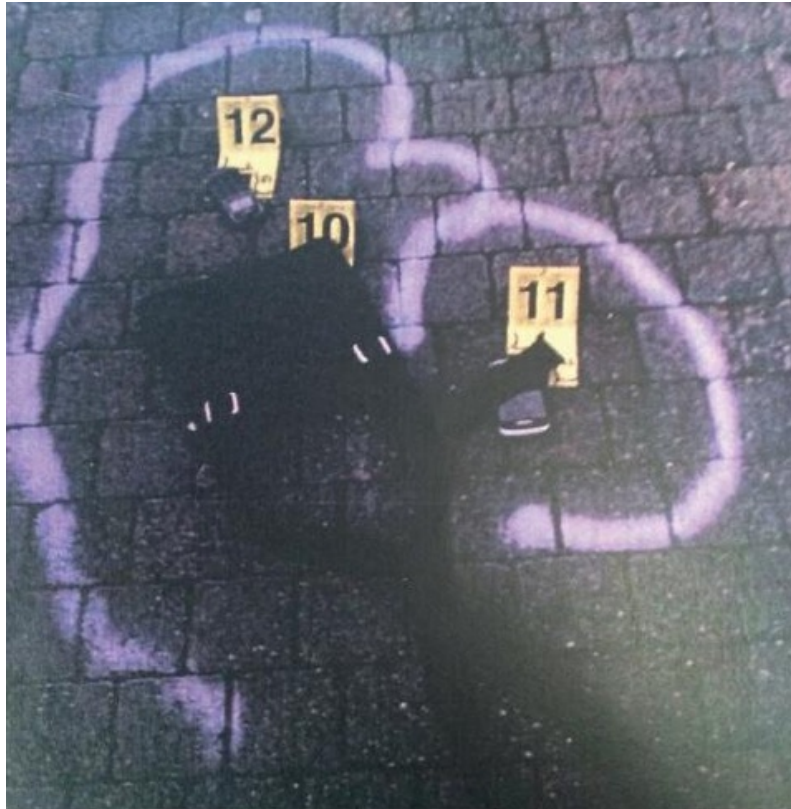
Het tasje van Najeb Bouhbouh