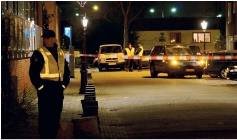
Politie doet onderzoek in de Staatsliedenbuurt