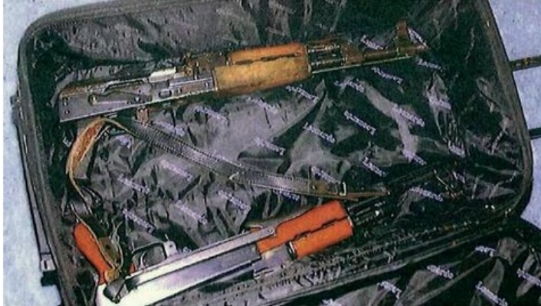
Kalashnikovs in een rolkoffer die wordt aangetroffen in een woning in de Staatsliedenbuurt