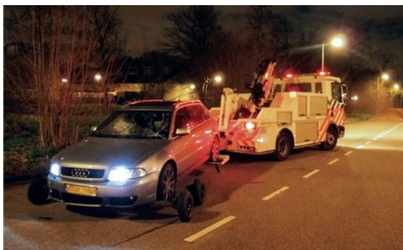
De Audi RS4 wordt weggesleept door de politie