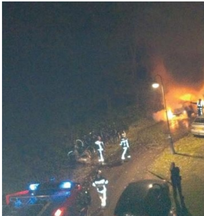
De grijze BMW die gebruikt werd bij de liquidatie in Antwerpen wordt teruggevonden in Amsterdam-West