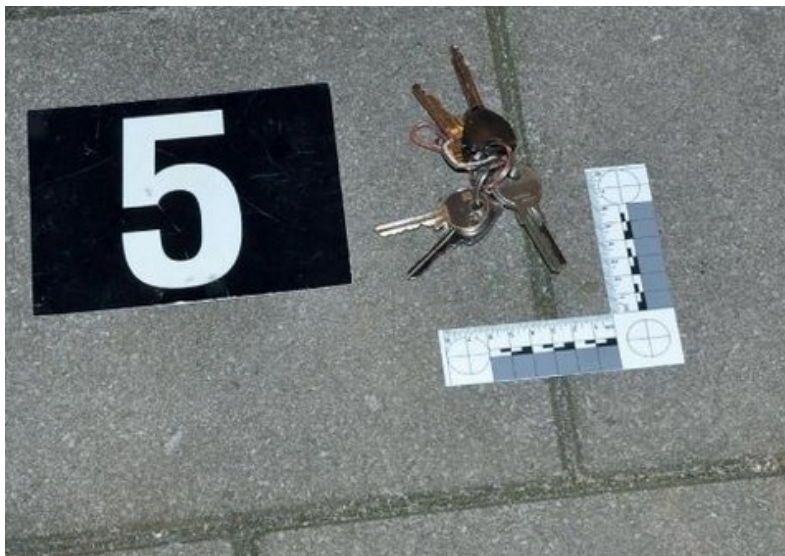
De sleutelbos die wordt teruggevonden op de plaats delict in de Comeniusstraat