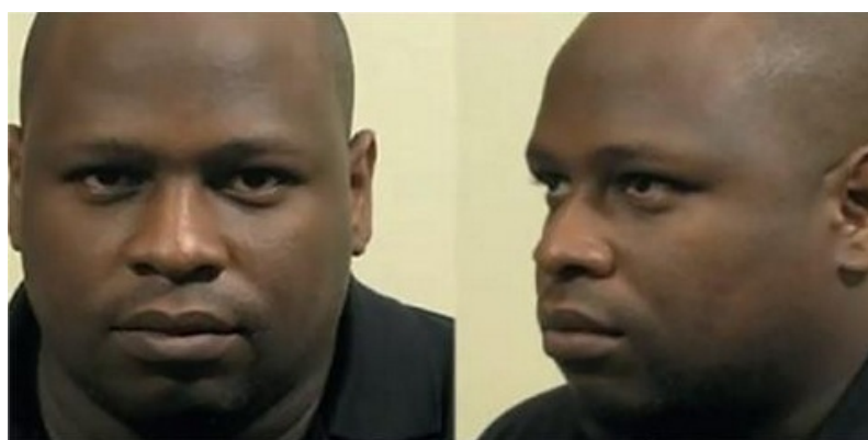
De politiefoto van