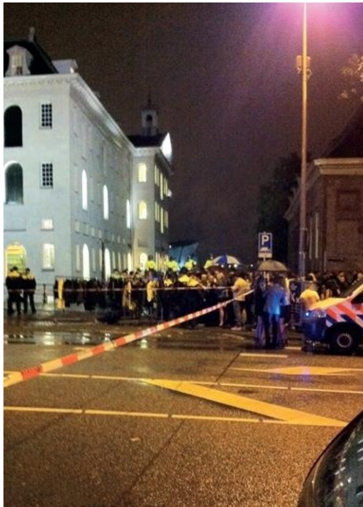
De politie heeft de omgeving van het Scheepvaartmuseum afgezet voor het publiek